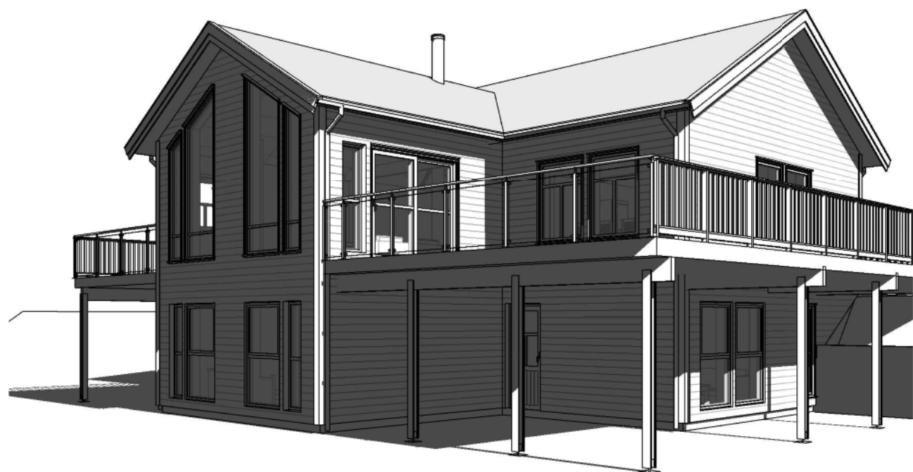
3D View 1