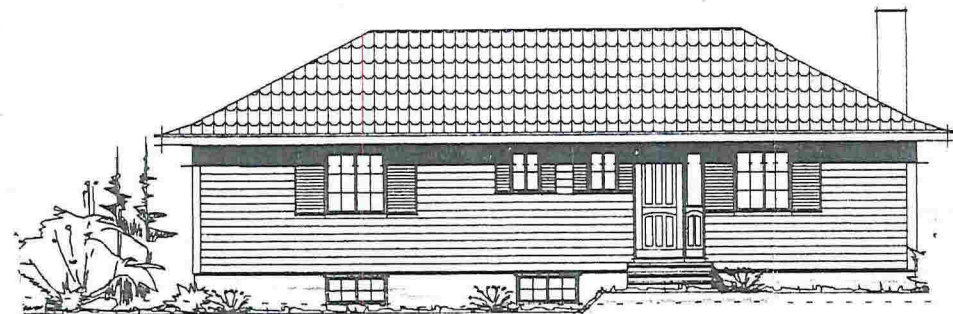
FASADE MOT NORDØST