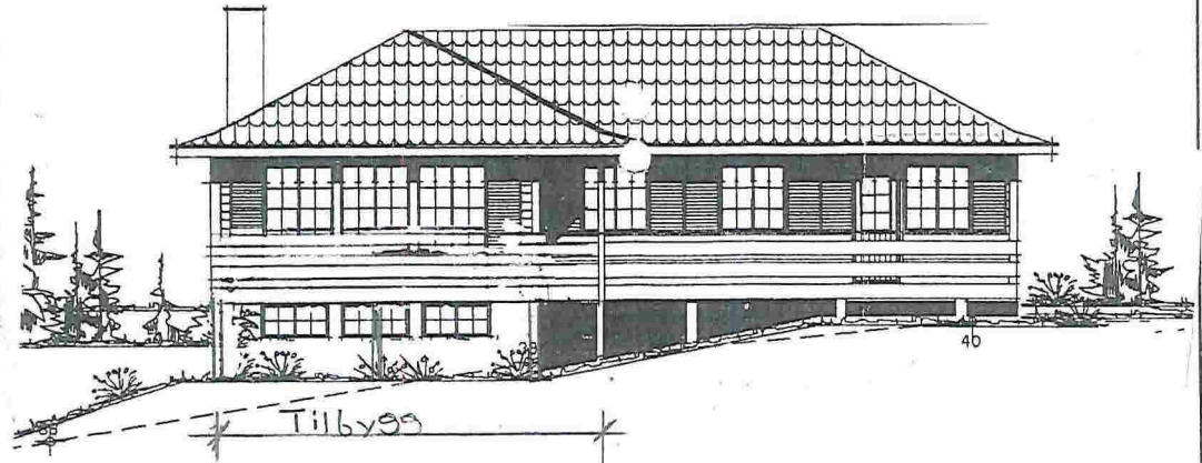
FASADE MOT SØRVEST