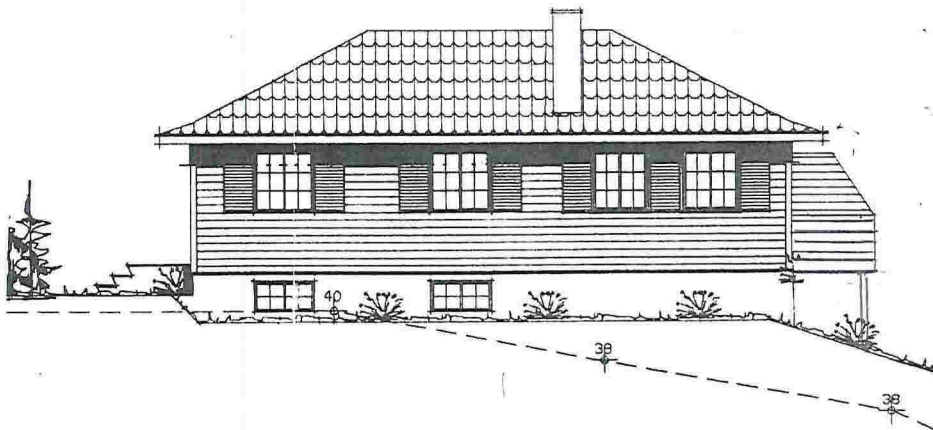
FASADE MOT NORDVEST