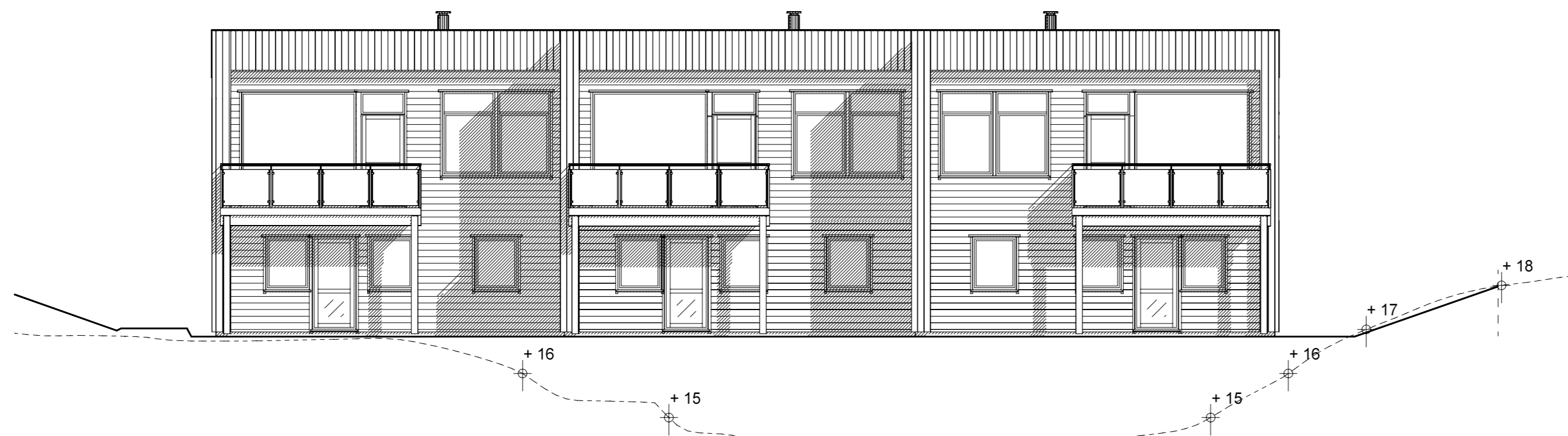
FASADE MOT SØR