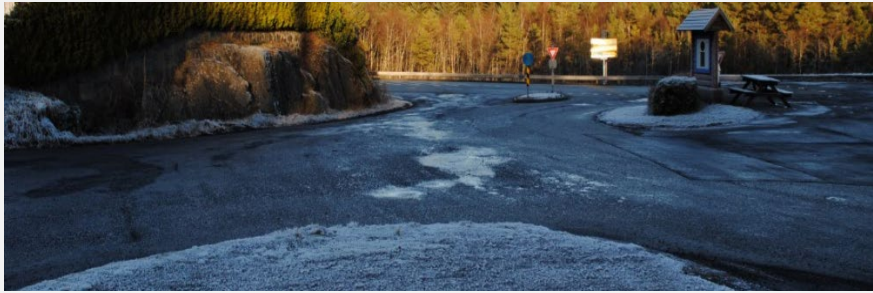
Syner avkøyring til FV57.

Statens vegvesen har under forarbeidet til plan stilt krav om at kryssområdet (o_SKV1) mellom FV57, FV 398 og FV400 skal vere med i planområdet. Dette med grunn i å regulere og leggje til rette for eit tryggast mogleg løysing for alle typar trafikantar.