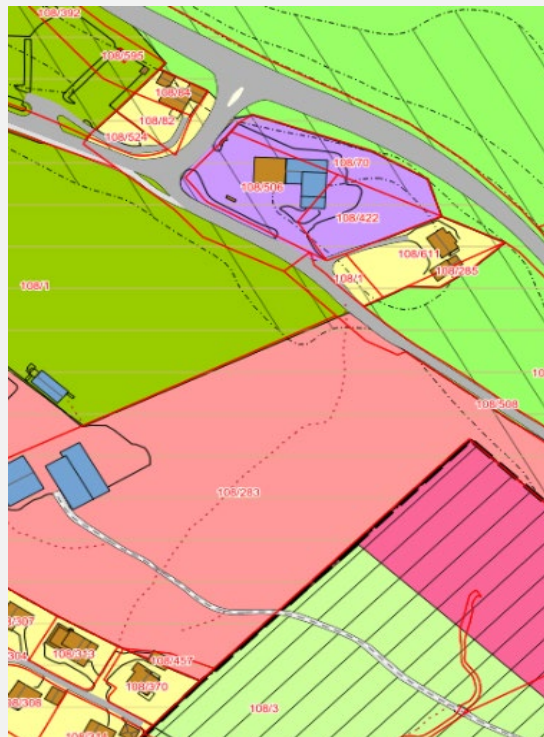
Utsnitt KPA 2011-2023

For det aktuelle området gjeld eit generelt krav om utarbeiding av reguleringsplan før tiltak kan setjast i verk, jfr KPA pkt. 1.1