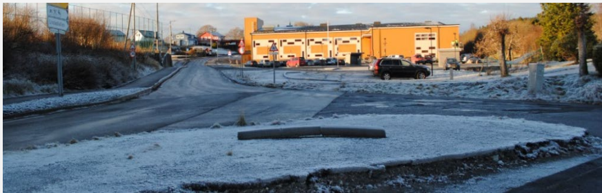
Syner kryss mellom FV398 og FV400.

Parkeringsområde (SPA2) ligg til høgre mot parkert bil i bilete.