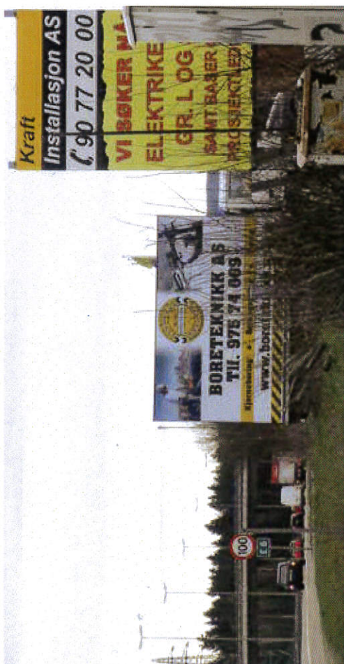
Ulovlig reklame langs motorveg.