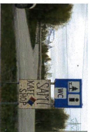
Ulovlig reklame festet til trafikkskilt.