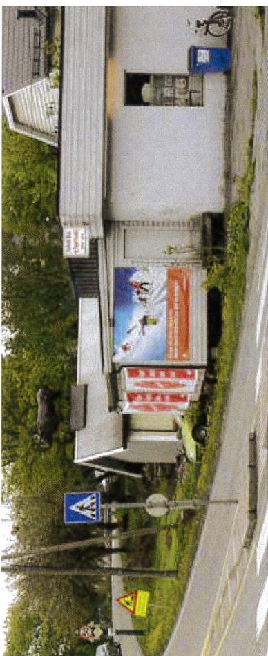
Ulovlig fasadereklame ved gangfelt.

I denne brosjyren finner du informasjon om en del viktige bestemmelser som regulerer reklame langs offentlig veg.