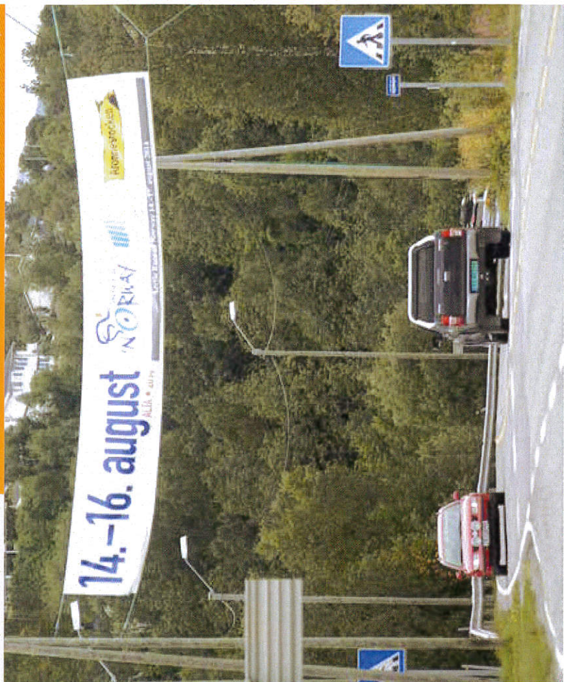
Ulovlig reklame ved gangfelt/bussholdeplass.

I denne brosjyren finner du informasjon om en del viktige bestemmelser som regulerer reklame langs offentlig veg.