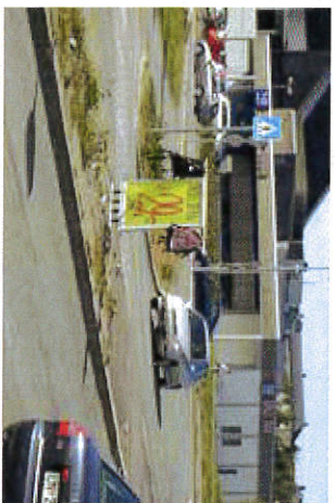
Ulovlig reklame på trafikkløy.

Reklame langs vegen er trafikkarlig dersom den hindrer rødvendig sikt, for eksempel i kryss eller ved gangfelt. Reklame kan også skape trafikkarlige situasjoner hvis den tar oppmerksomheten bort fra vegen og trafikken, det vil si skaper distraksjonsfare. På fortau og gangveger kan reklame være til hinder for fri ferdsel, særleg for syns- og forflyttingshemmede.