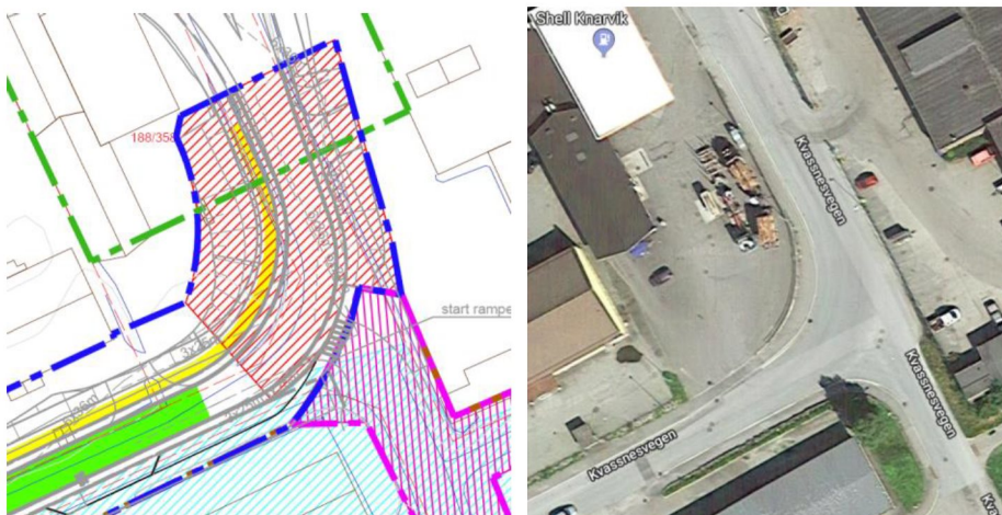
Fig. 1. Utsnitt fra faseplan 6, tilsvarende utsnitt fra Google Maps til høyre. Entreprenørgrense for 1. byggetrinn vist med blå stipling, 2. byggetrinn med grønn stipling.

Vaskehallen vil fortsatt kunne brukes som i dag. Det vil være nok manøvreringsareal for denne.