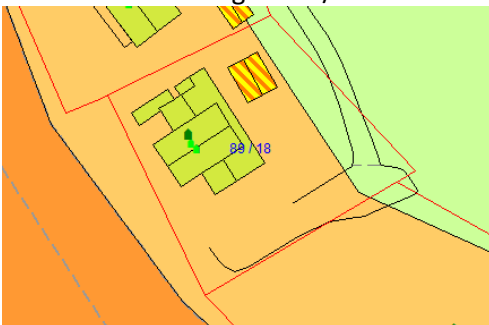
Situasjonskart, datert 05.11.2018