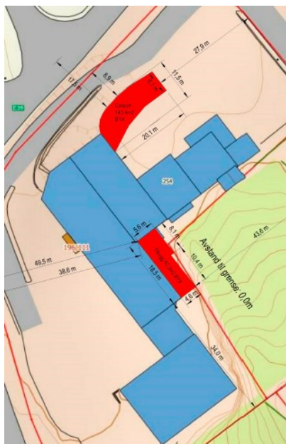
Godkjent carport i vedtak datert 25.04.19

Det vert elles vist til søknad motteken 23.05.19 og supplert 05.06.19.