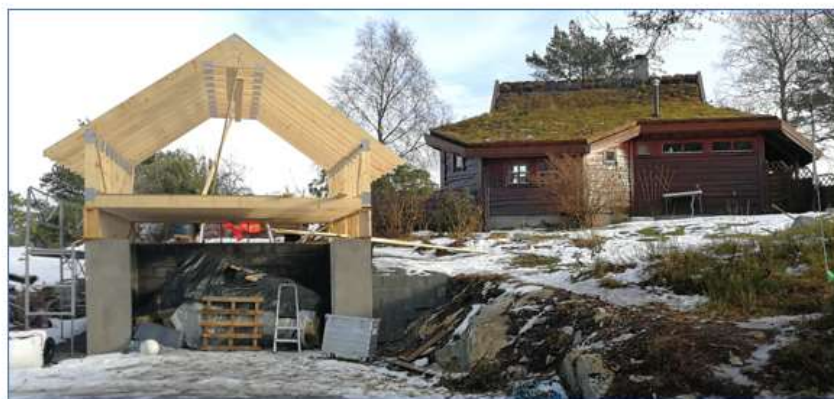
Manglande visuelt samsvar mellom garasje og eksisterande bygningar på eigedomen