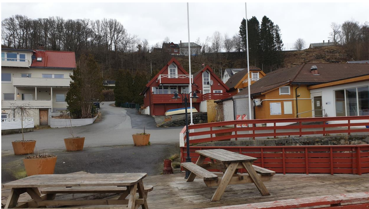
Delar av uteområdet mot sjøen.