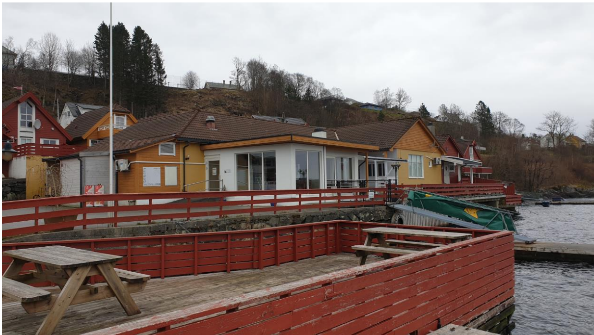
Restaurant/serveringsbygget i område N1.