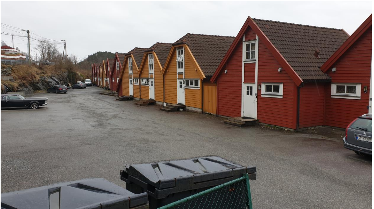
Parkeringsplass i nord, bakkant av bustadane bak restaurantbygget.