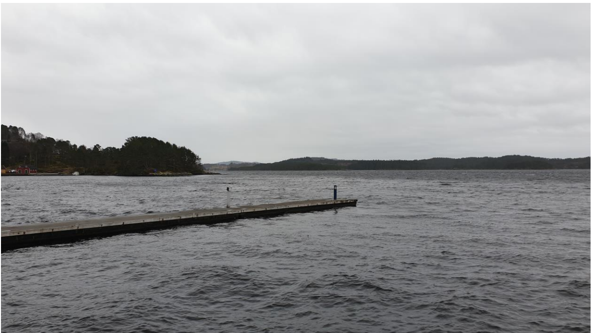
Brygge i tilknytning til planområdet.