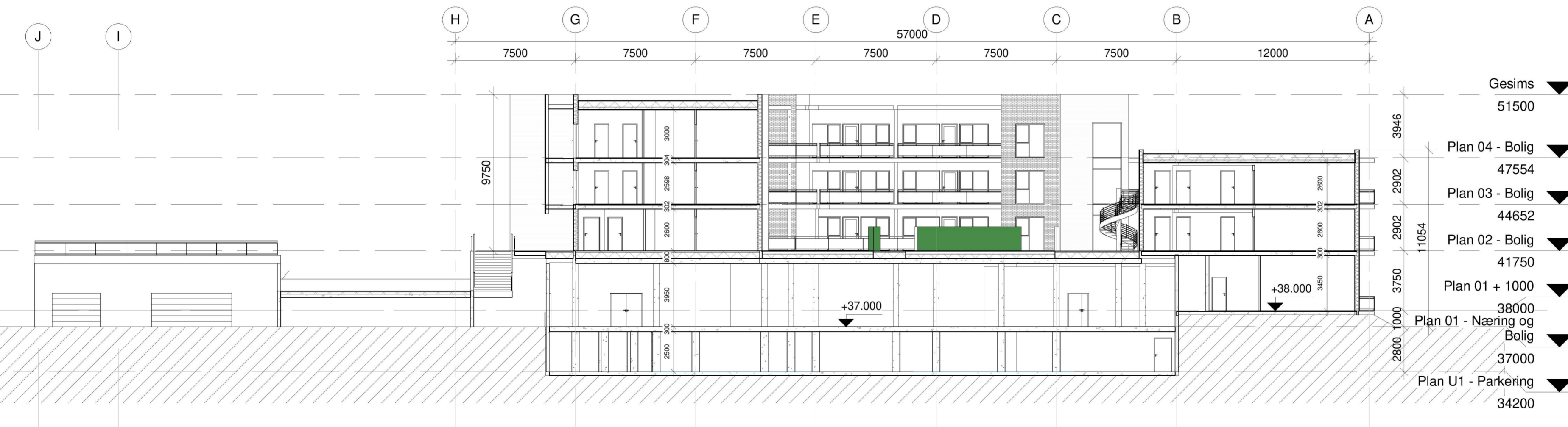
2 Snitt G 1 : 200