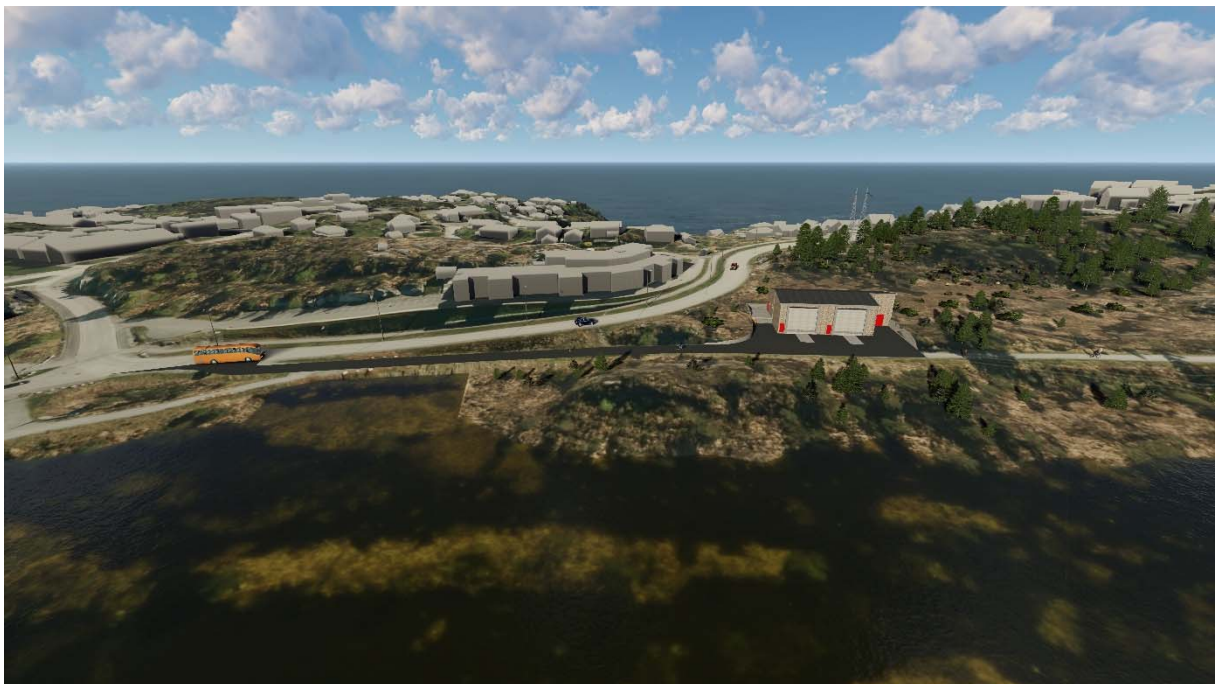
Figur 6. Samme plassering som på figur 4 og 5.