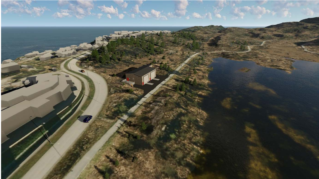
Figur 5. Samme plassering som på figur 4, men her sett i fugleperspektiv.