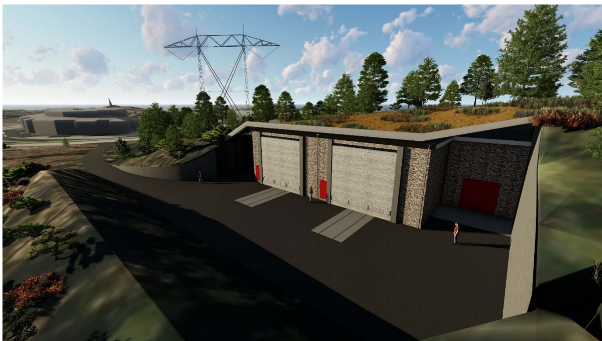
Figur 2. Samme plassering og utforming som på figur 1, men sett fra en annen side.