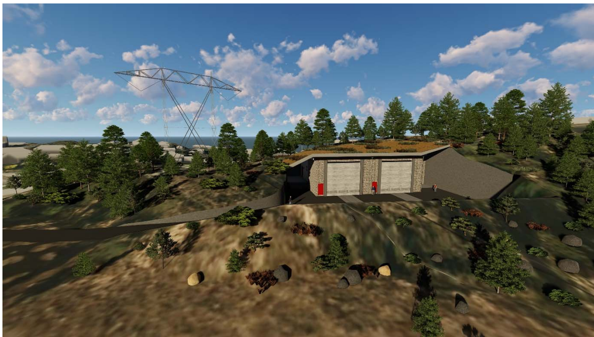
Figur 1. Tegning som viser mulig innplassering av transformatorstasjonen i terrenget på BKK Netts prefererte lokasjon.