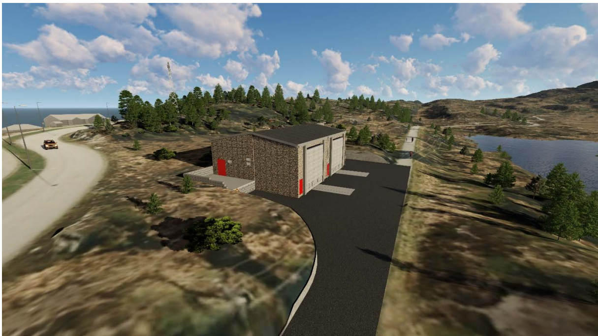
Figur 4. Transformatorstasjonen innplassert på areal benevnt o_BE2.