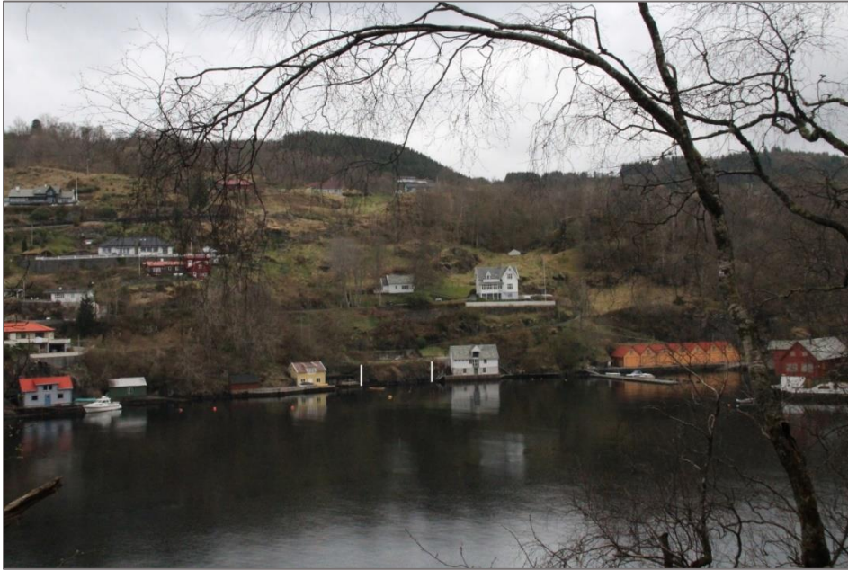
Austsida av Kvamsvågen. Vertikale kvite strekar markerer strandlina framføre FTF1.