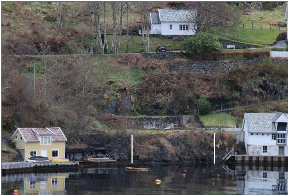
FTF1 sett frå sjøtsida, der vertikale kvite strekar avgrensar strekninga med urørd strandline.