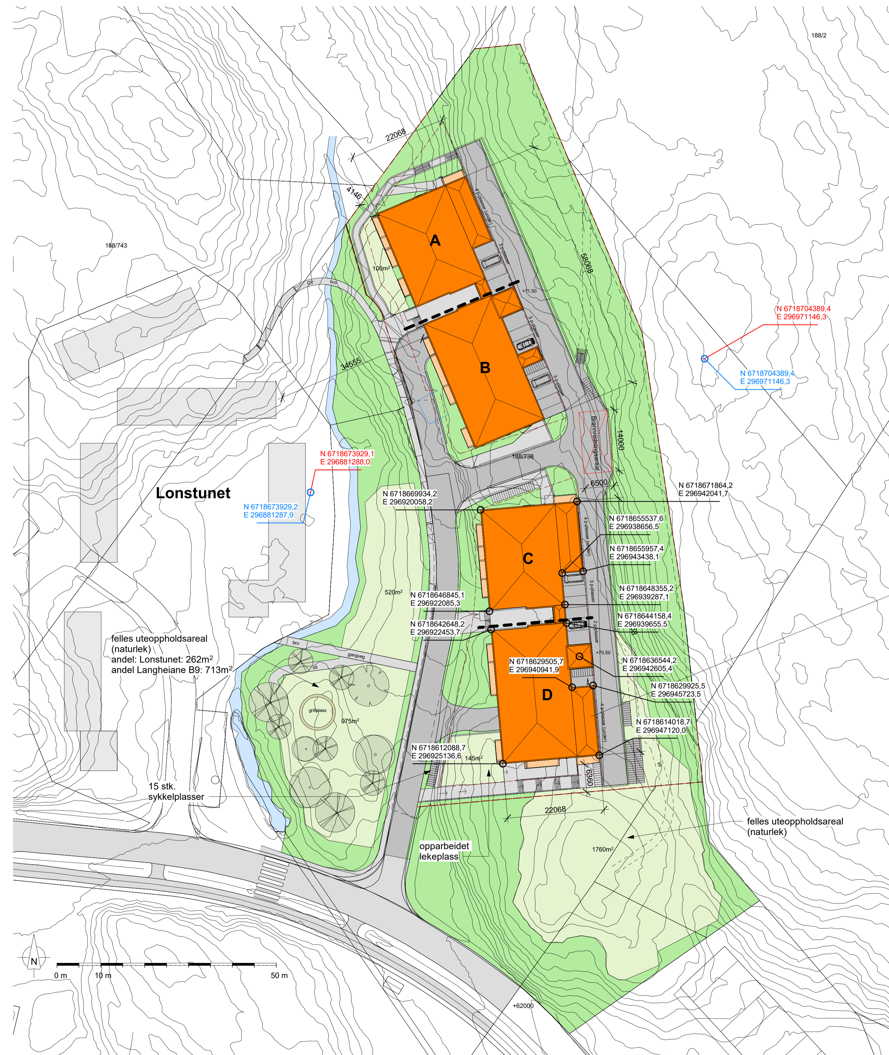
1 Situasjon 1 : 500