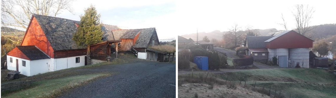
Foto av eksisterende låvebygning

Spurkeland Vikinggard as har engasjert arkitekt og ansvarlig søker for å utarbeide søknad om etablering av forsamlingsrom i eksisterende låvebygning. Forsamlingsrommet skal være publikumsrettet. Ansvarlig søker ber om redegjørelse fra kommunen i forhold til krav til dokumentasjon.