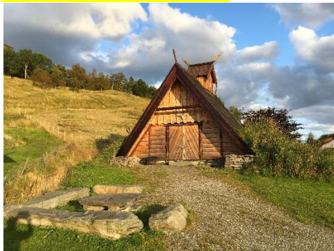
Foto av eksisterende vikinghus

Spurkeland Vikinggard har engasjert arkitekt og ansvarlig søker for å søke om byggetillatelse for eksisterende vikinghus. Vikinghuset er et forsamlingshus for publikum. I sammenheng med utarbeidelse av søknad om byggetillatelse vil det bli utarbeidet tegninger og relevant dokumentasjon. Dette arbeidet er per i dag ikke igangsatt.