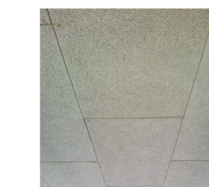
Treulselment systemhimling natur