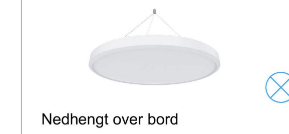
Nedhengt over bord