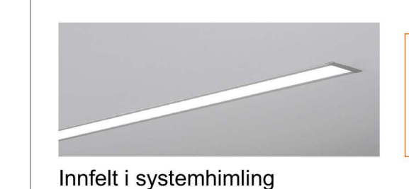
Innfelt i systemhimling