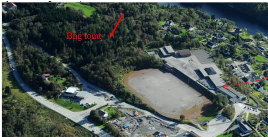
Bilde 1 –Tomt

Lindås kommune (Kunden) skal bygge ny kommunal barnehage i sone nord ved Nærsenteret Lindås.