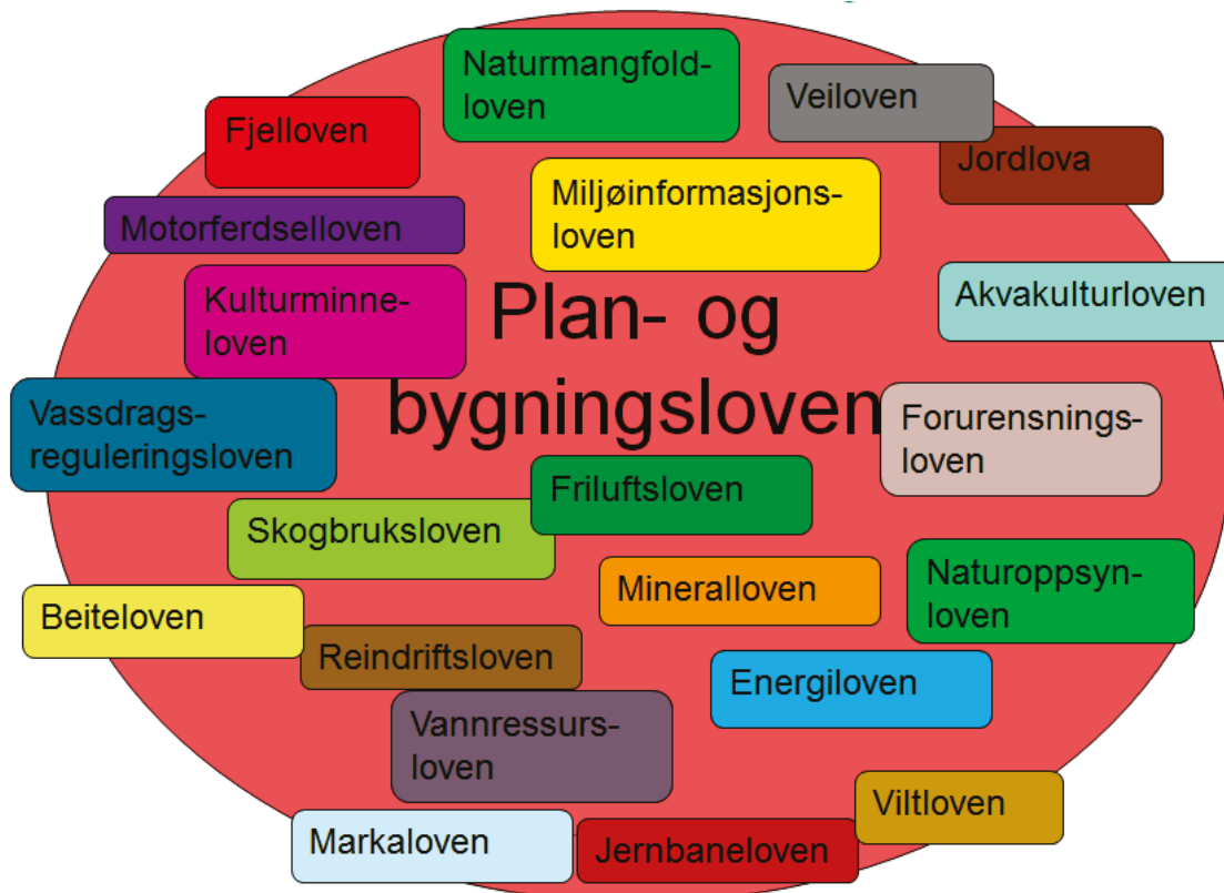
Figur 1: I tillegg til plan- og bygningsloven har en rekke lover betydning for utmarksforvaltningen. Listen er ikke uttømmende.

Planlegging etter plan- og bygningsloven er ment som en felles arena for avveining av ulike interesser knyttet til arealbruk. Det er flere forhold som begrenser planleggingens rolle som styringsmiddel i utmarksforvaltningen. Mens enkelte sektorlover er fullt ut integrert i plansystemet, slik som veiloven, gjelder andre forvaltningssystemer parallelt med, eller ved siden av, plansystemet, f.eks. energisektoren. I tillegg vil forslag om nye tiltak kunne endre forutsetningene i vedtatte planer. Gjennom dispensasjoner eller omregulering kan kommunene godkjenne tiltak i strid med arealformålet i eksisterende planer. Planer kan dermed bli oppfattet og praktisert som et utgangspunkt for, snarere enn et resultat av, forhandlinger.