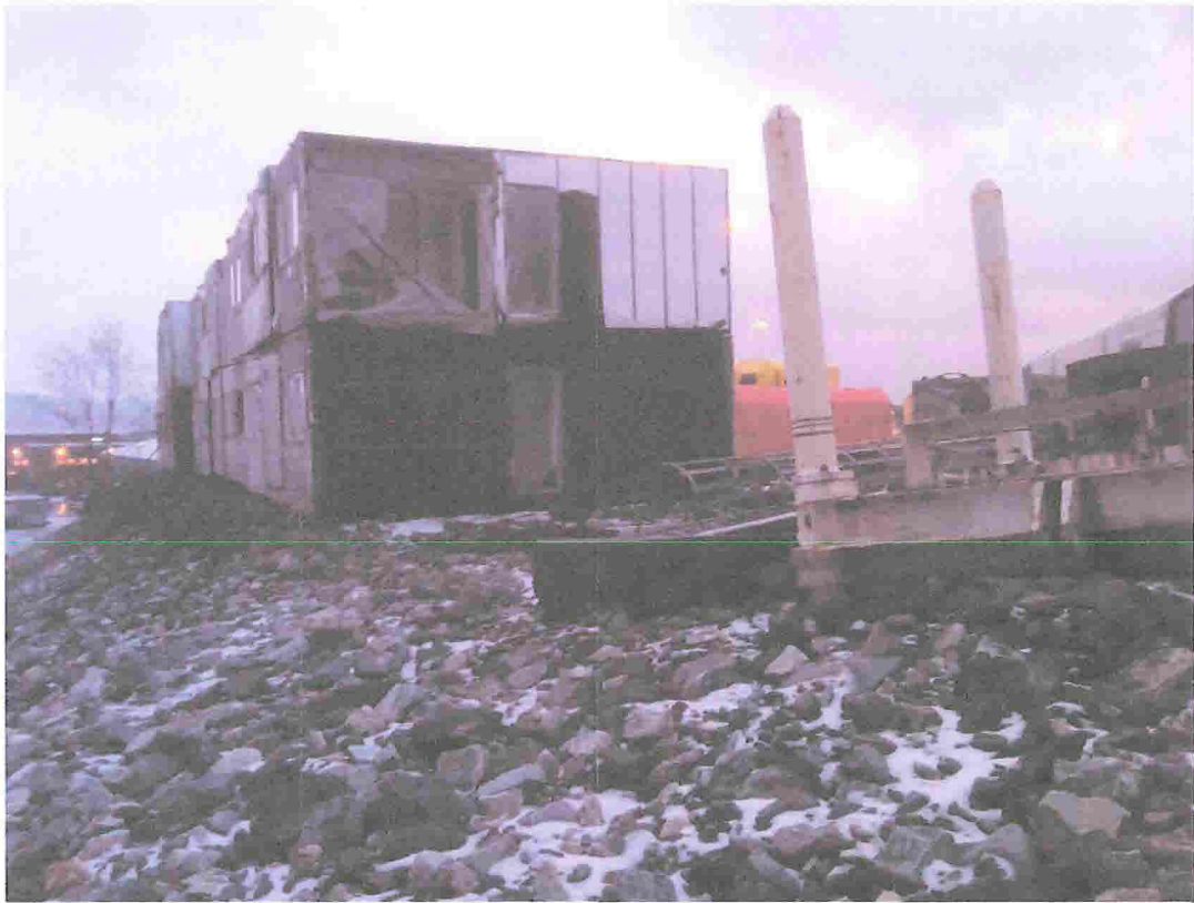
Disse brakken har stått så lenge at de nå er utdatert og kommer aldri mer i bruk. Det er kostbart for eier å få dem fjernet