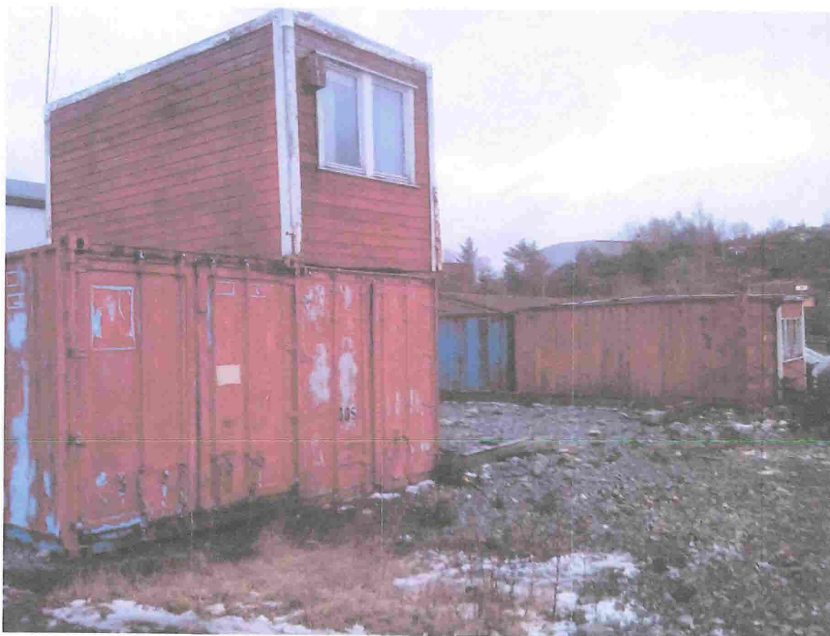
Typiske ting som lagres på lagerplasser i utkanten. Dette har stått i mange år.