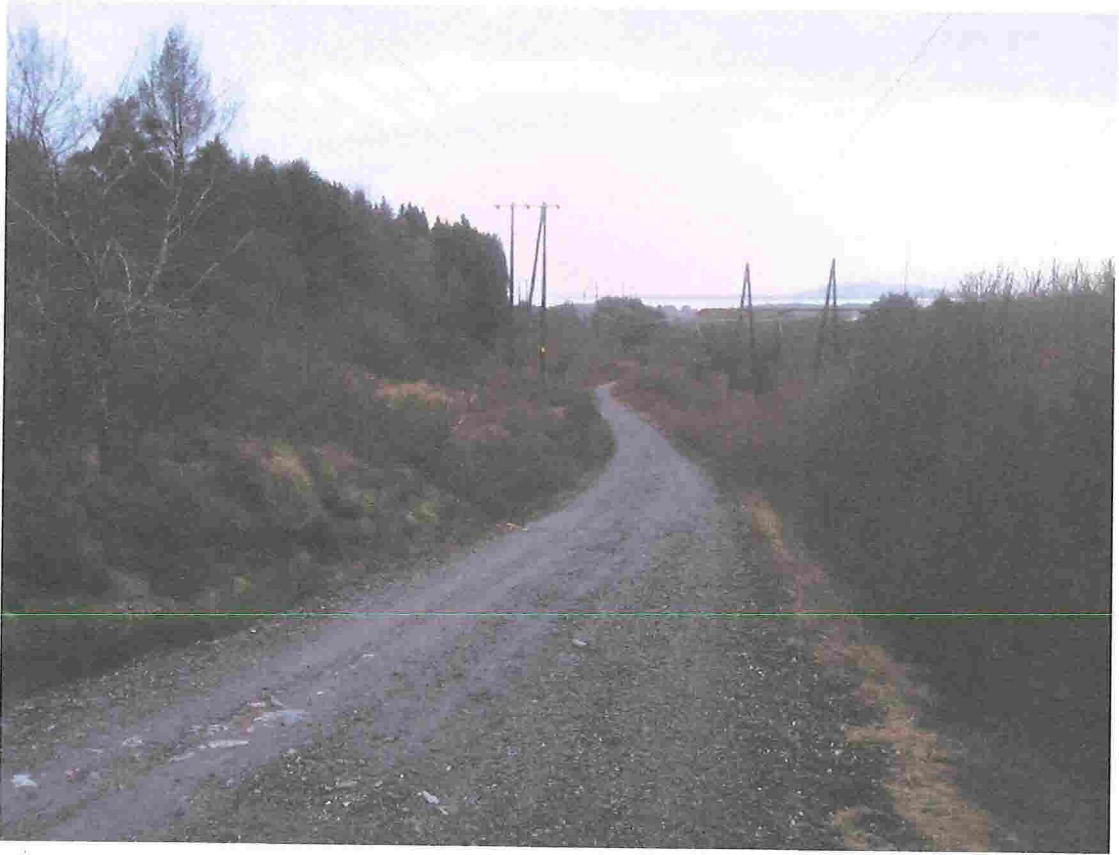
Grense mellom industri og natur/buffersone bør gå langs eksisterende høyspentlinjer