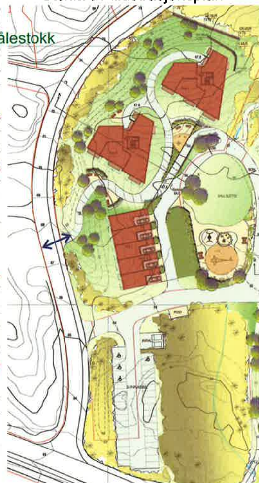
Utsnitt av illustrasjonsplan