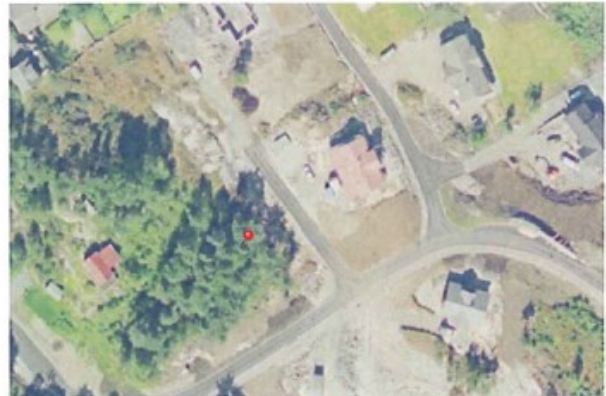
Figur 1 FLYFOTO 2003

Elles vil vi peike på at situasjonen i dag har vore slik sidan utbygginga starta i 2003, og at alle "partar" inkludert kommunen (moa gjennom si tidlegare sakshandsaming) har akseptert løysinga som no er 11 år.