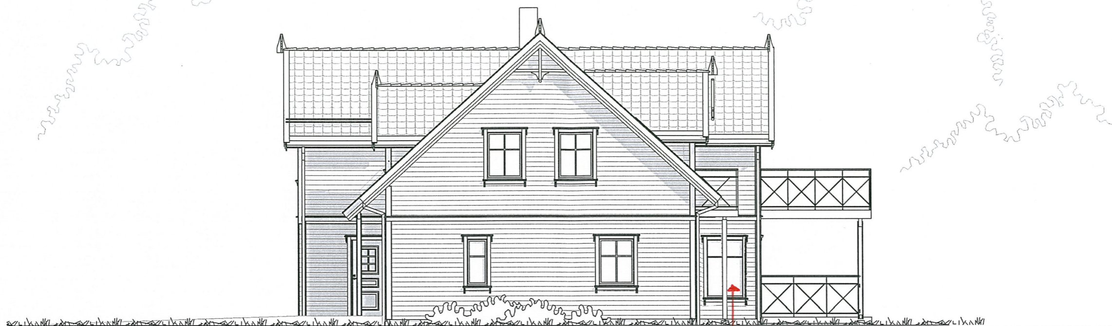
Fasade 2 1 : 100