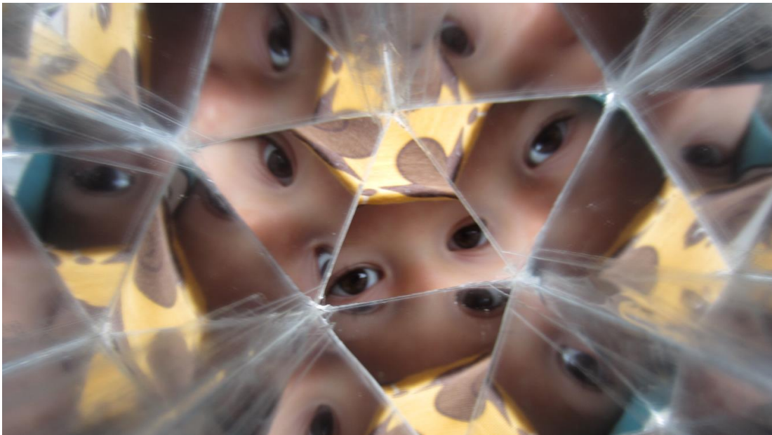
2-åring kikkar gjennom kaleidoskop.

Planen er dels på bokmål og dels på nynorsk. Årsaka er at me har tilsette som nyttar det skriftspråket som fell dei nærast. Me har valgt å la dette spegle seg i det du les.