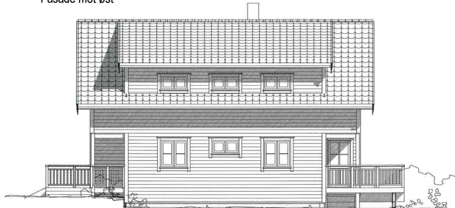
Fasade mot vest

Alle mål og høyder må tilpasses ekst. bygg.