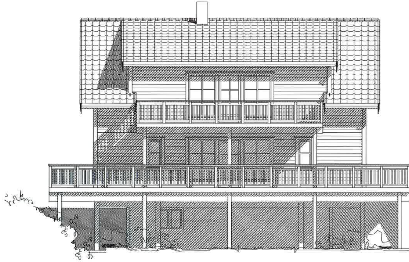
Fasade mot øst