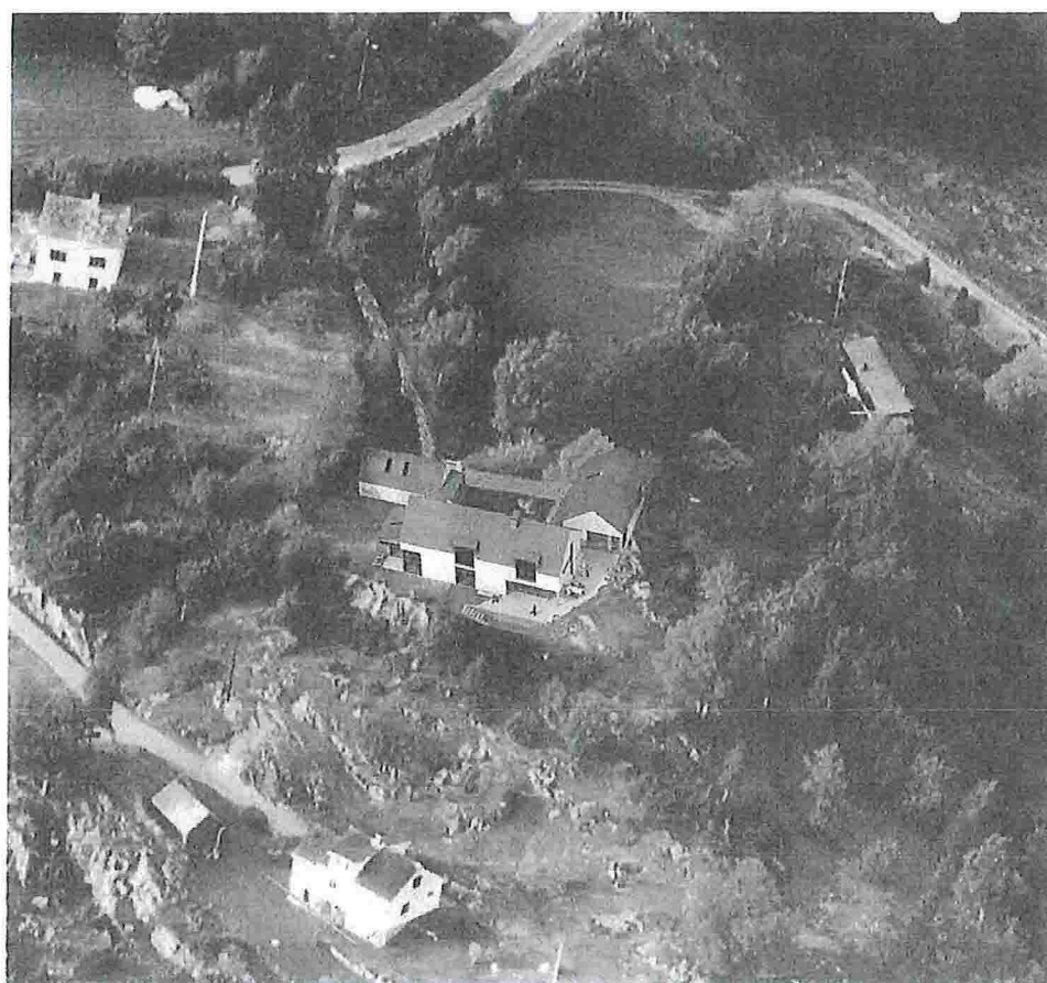
ILLUSTRASJONSFOTO: Planlagt ny situasjon med hovedhus, anneks og garasje.