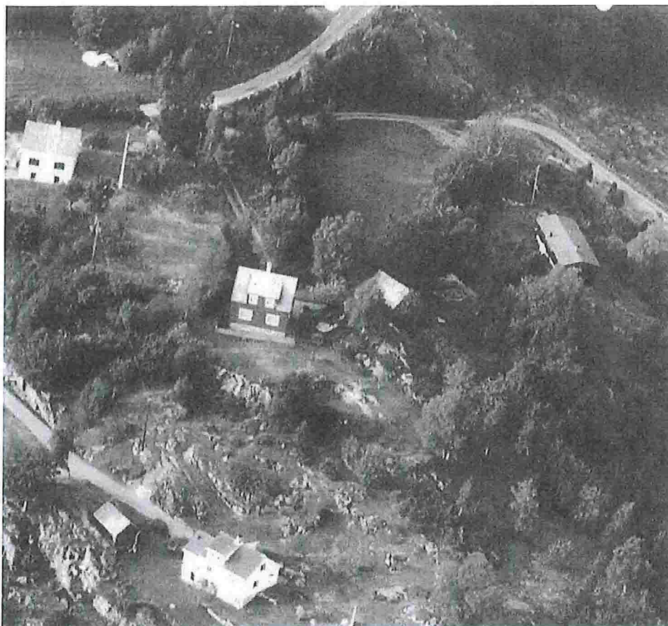
FOTO: Eksisterende situasjon med hovedhus og uthus.

partnere arkitekter as MNAL arkitektbedriftene