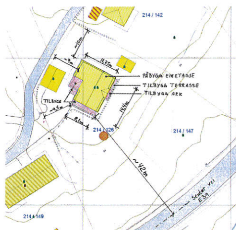
Utsnitt frå situasjonsplan vedlagt søknaden.

Postadresse Statens vegvesen Region vest Askedalen 4 6863 Leikanger