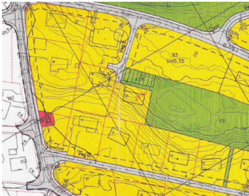
Utsnitt av reguleringsplanen