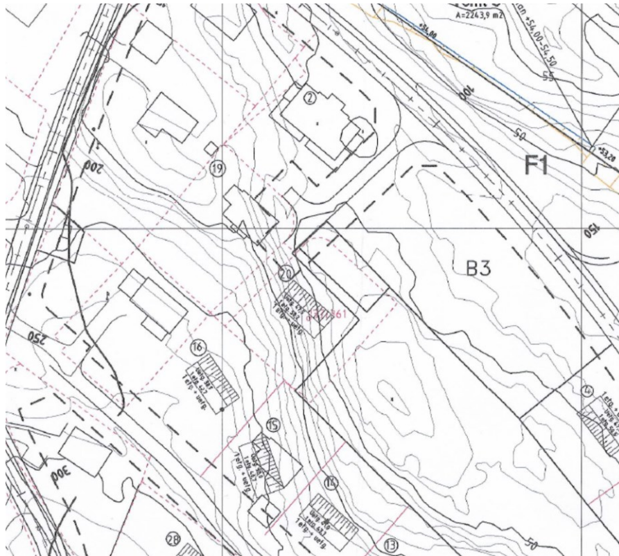
Utsnitt av illustrasjonsplanen for området