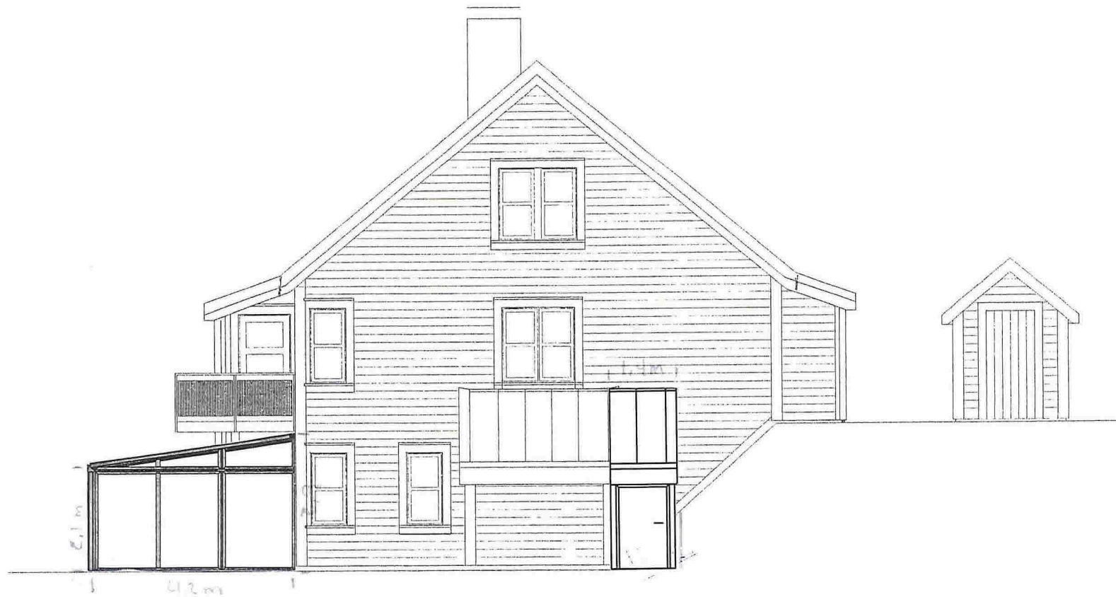
Fasade A - "aust"