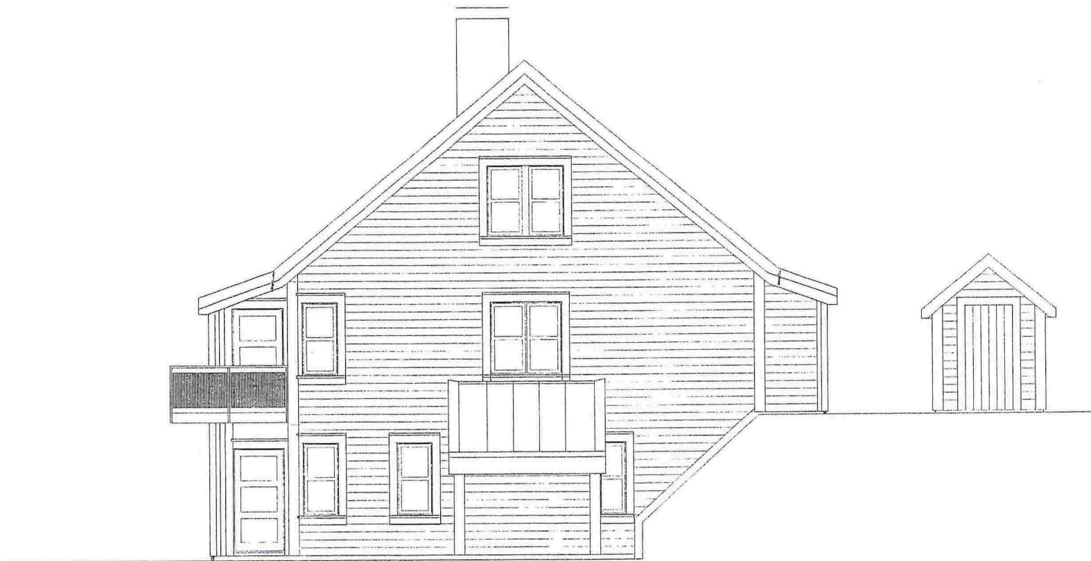
Fasade A - "aust"