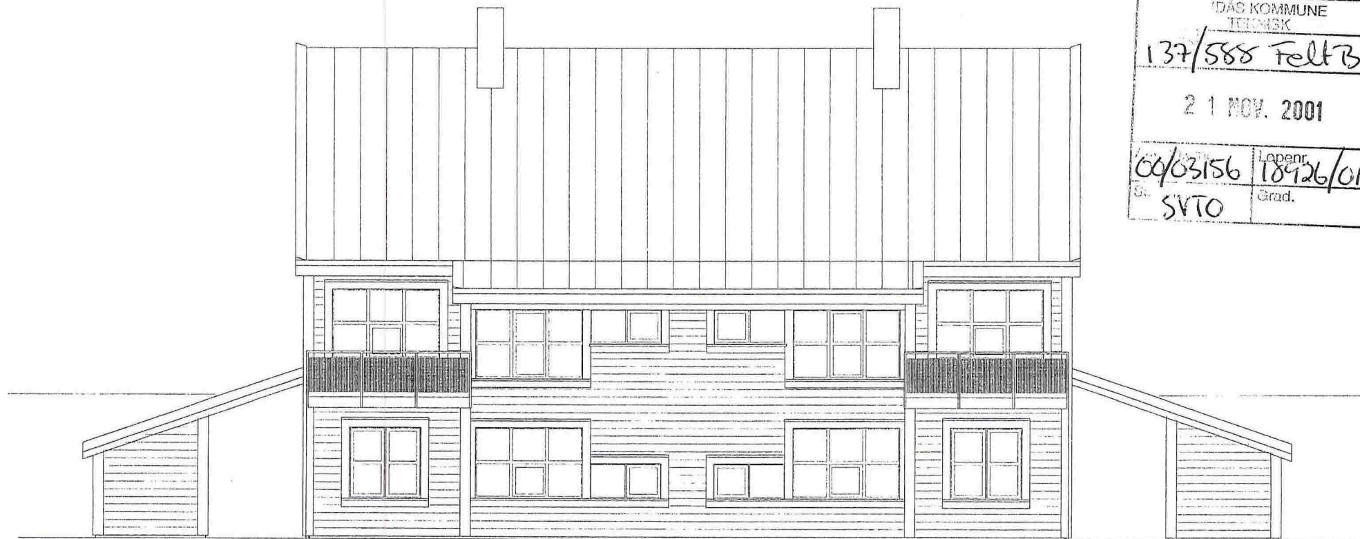
Fasade A – "Syd"