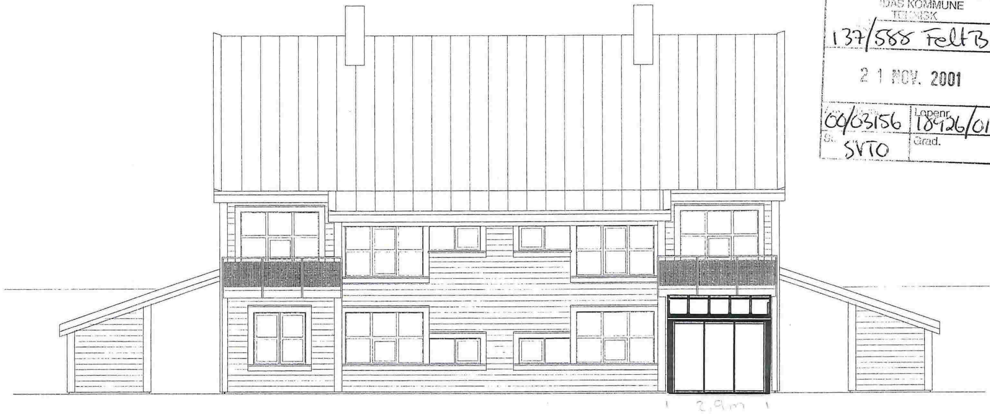
Fasade A - "Syd"