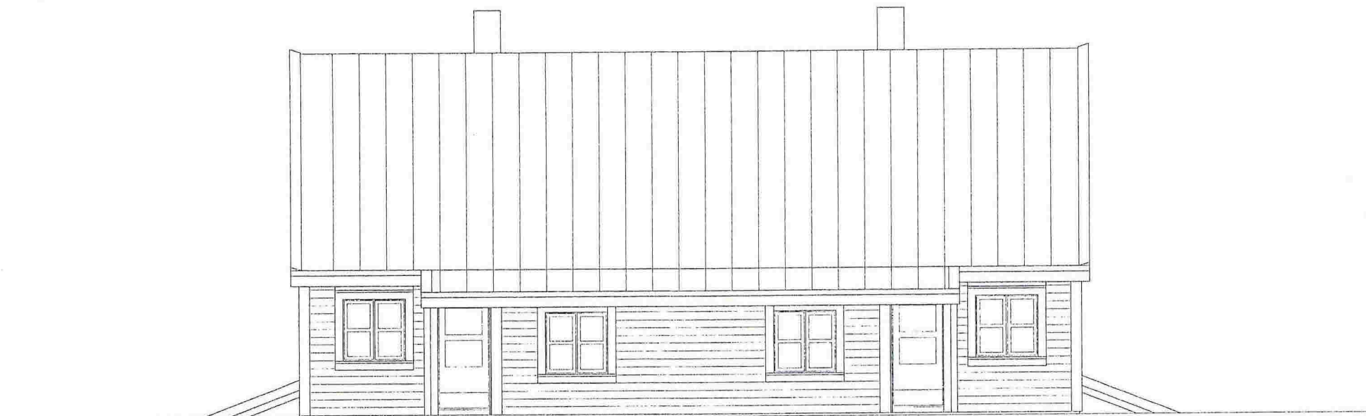
Fasade A - "Nord"