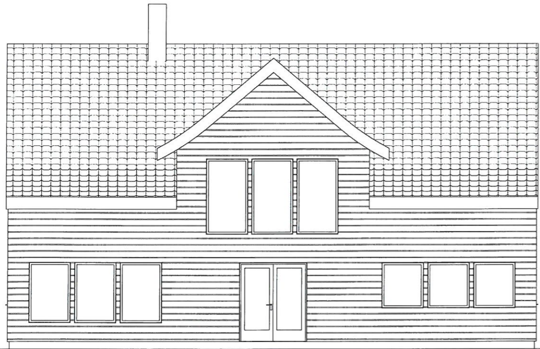
Fasade Øst - Byggesak 1 : 100