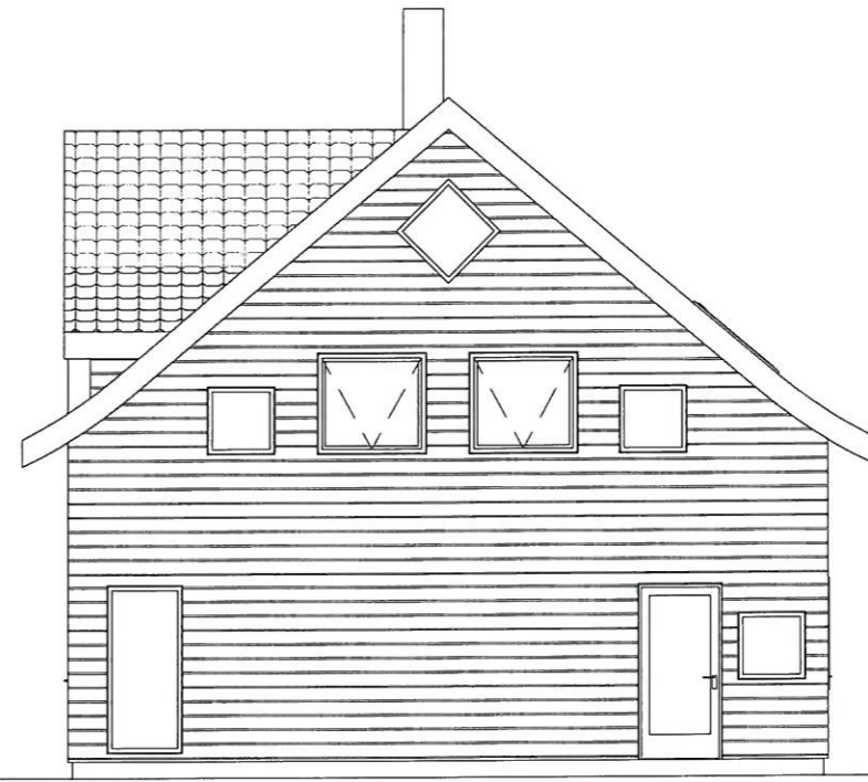
Fasade Nord - Byggesak 1 : 100