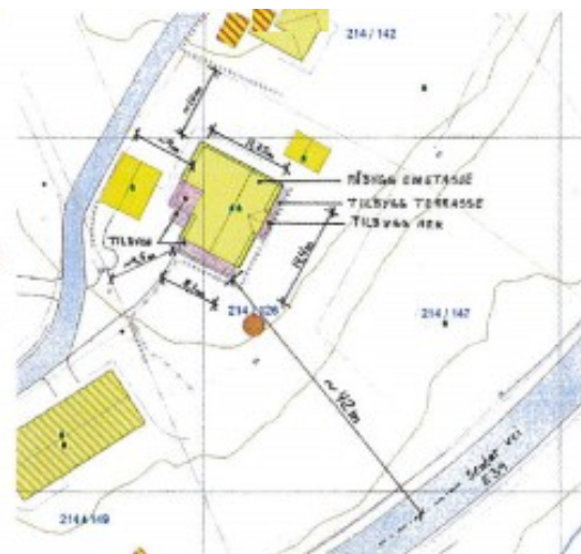
Utsnitt frå situasjonsplan vedlagt søknaden.