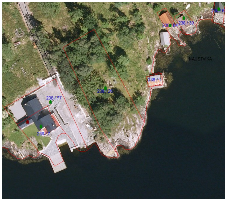
Flyfoto som syner den omsøkte eigedomen.