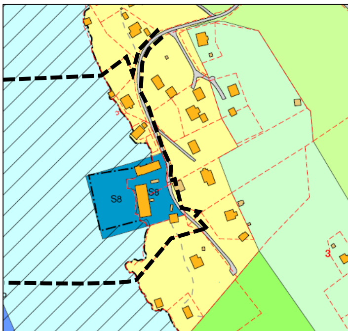
Figur 1: Utsnitt av kommuneplanen.

Det ligg to bygg i planområdet, Åsgard 29 og 31, som stammar frå Aasgard møbelfabrikk som heldt til her frå 1935 til 1969. I 1950 brann Åsgard 31, men ein ny og større fabrikk vart reist same året. I 1969 brann dette bygget ned for andre gong, og etter dette vart fabrikk flytta til Fammestad, medan det på Åsgard vart sett opp eit lagerbygg i staden. Frå 1969 til 1981 vart bygga brukt som lager for fabrikk. Etter 1981 har bygga vore eigd av Aasgard sameige, og har vore brukt til lagring av båtar m.m.