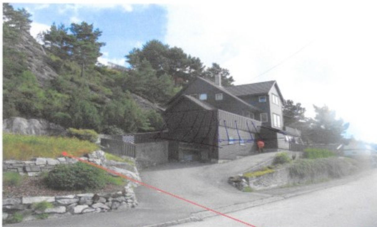
Bilde 1. Viser eiendommens gårds plass og parkeringsmuligheter. Det er kun muligheter for å parkere to biler med fri utkjørsel. Dvs at det må etableres to biloppstillingsplasser til i dette området hvis man skal få hybelen godkjent som egen boenhet.