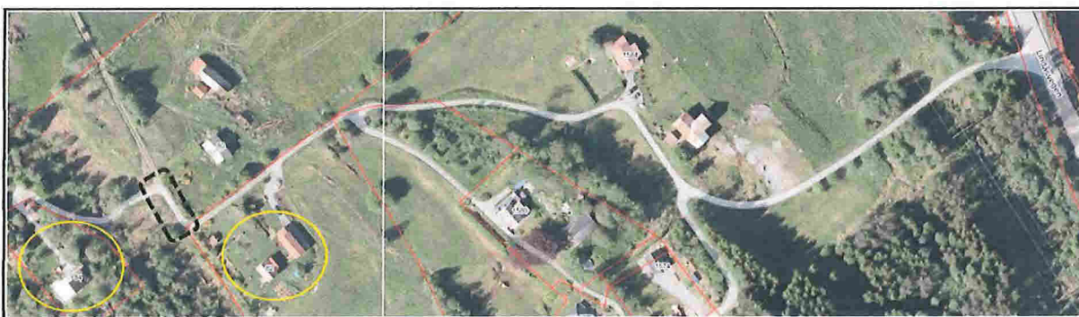
Figur 2: Gul sirkel syner eksisterande bustader vegforholda ikkje er avklart.

Eksisterande avkjøringsveg i aust, sjå figur 2, vert opparbeida som ny tilkomst for 56/9 og dei to andre bustadane. Dette vil medføra at ein tek i bruk ein mindre del av postvegen (vist med svart strek), noko som truleg vil føra til lågare kostnader ved opparbeiding av veg. Det er også den mest naturlege traseen med tanke på avstand til hovudvegen.