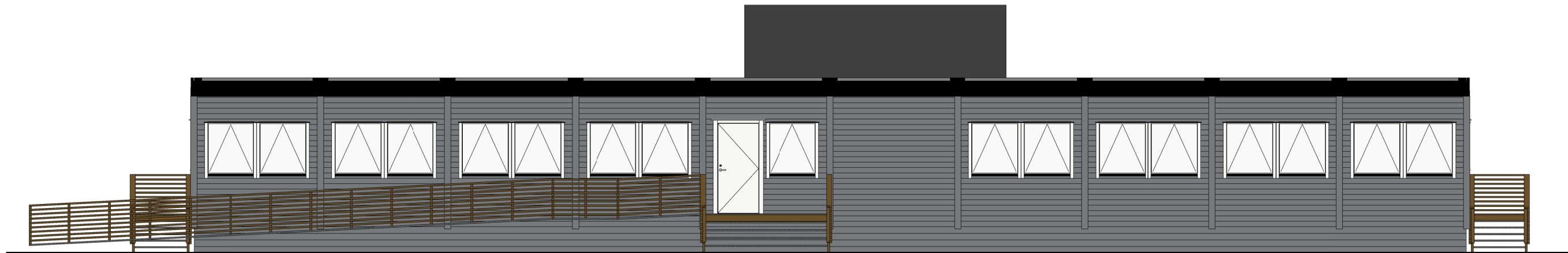
Sør 1 : 100