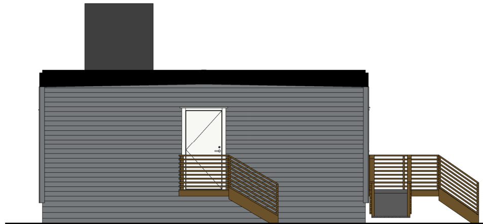
Vest 1 : 100