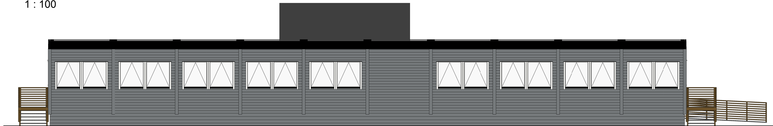
Nord 1 : 100