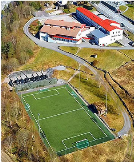
Aktivitetssal utgjer kjernen i bygget til venstre

Salen vert og nytta til øvingslokale for to brassband, og kulturskuleundervisning.