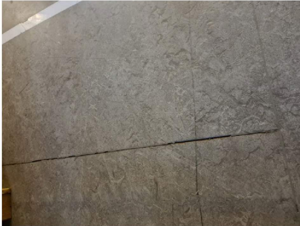
Døme på rifter&sår i belegget

Regelendringar i spelemiddelordninga for aktivitetssaler presiserer i pkt 2.6.5 at « offentlige og private skolars saler( gymsaler m.v) for kroppsøving ikke er aktivitetssaler og faller utenfor spillemiddelordningen for idrettsformål med mindre anlegget oppfyller mål for pkt 2.6.8 ( basketball innendørs) eller pkt 2.6.42 ( volleyballanlegg innendørs) og skal holde åpent for allmenn idrettslig virksomhet utover skoletid i henhold til punkt 4.»