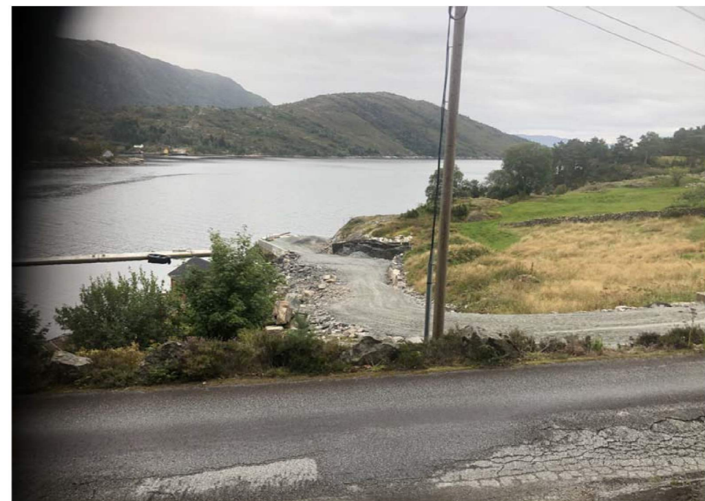
NY VEG OG PARKERINGSPLASS. LITT FINPUSS STÅR AT MENI HOVEDSAK FERDIG

BIM modell ArchiCAD 14 NOR Filplassering: D:\BRKvingeData\Mine dokumenter\PROSJEKT\Tegninger\2014\14190_Småbåtanlegg\Småbåtanlegg Kvingo BM 2.pln