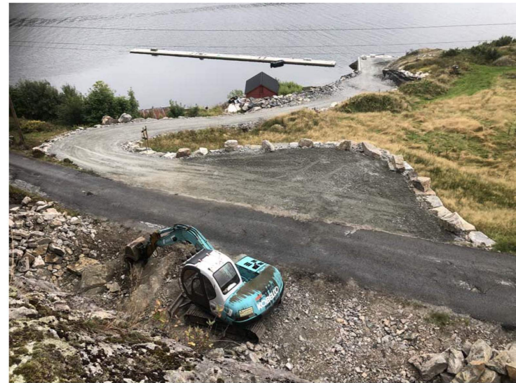
NY AVKØYRSLE MED EIN DEL ATTSTÅANDE ARBEID

DEL AV VEG OG PARKERING DET HER SØKJAST BRUKSLØVE FOR NY FLYTEBRYGGE OPPANKRA