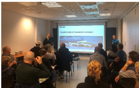
Bedriftspresentasjon ved Viking Aqua

Det var tydeleg at næringslivet såg fram til å treffe på både jobbsøkarar, ungdommar og andre bedrifter, responsen på invitasjonen var svært god med heile 19 verksemder på plass, (fullt hus). Godt samarbeid med skulane gjorde at alle ungdomsskulane i kommunen dukka opp saman med foreldre og/eller lærarar. Saman med jobbsøklarar og andre interesserte, møtte om lag 160 stk. opp for å prate meir med aktuelle arbeidsgjevarar, høyre bedriftspresentasjonar og etablere kontaktar. Tilbakemeldingane frå næringsliv var svært gode og fleire bedrifter sat att med reelle søkarar og personar som vart oppmoda om å søkje jobb.