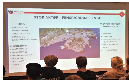
Bedriftspresentasjon ved Wergeland-gruppa