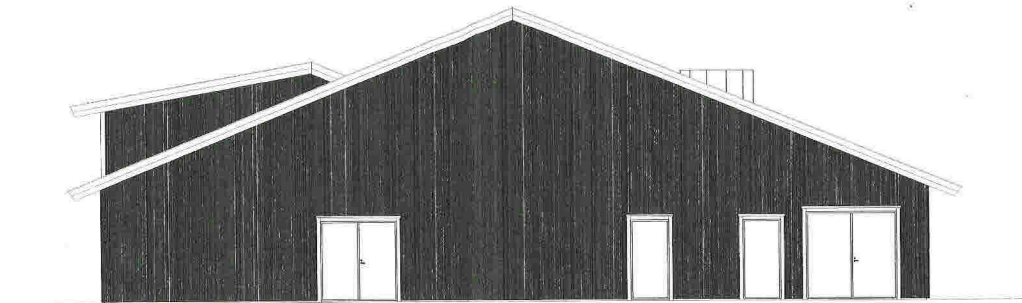
Fasade mot sør