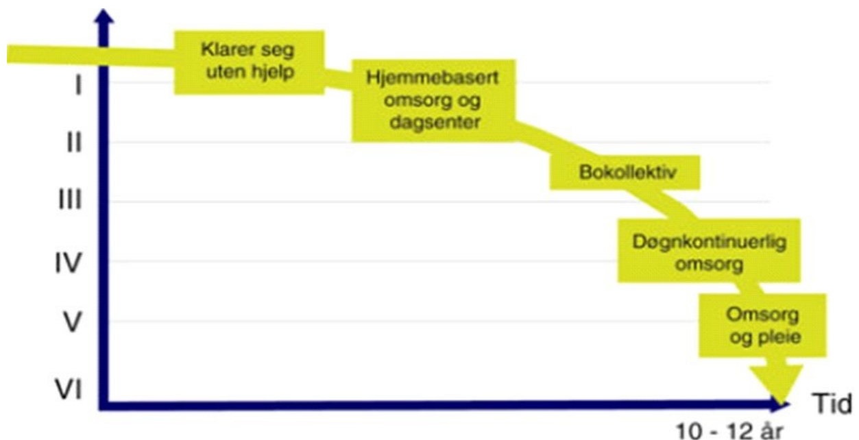
Fig. 1. Bergers skala viser utvikling ved Alzheimers sjukdom over ein 10 – 12 års periode.

Sjukdomen artar seg ulikt frå person til person. Den vanlegaste demenstypen er Alzheimers sjukdom (57%). Sjå fig. 1 for utvikling av Alzheimers sjukdom. Dei resterande 40 % har andre former for demenssjukdom eller blandingsformer av demens. Dei som blir ramma vil gradvis fungere dårlegare og til slutt bli heilt avhengig av hjelp. For nokon vil sjukdomsutviklinga utvikle seg raskt.