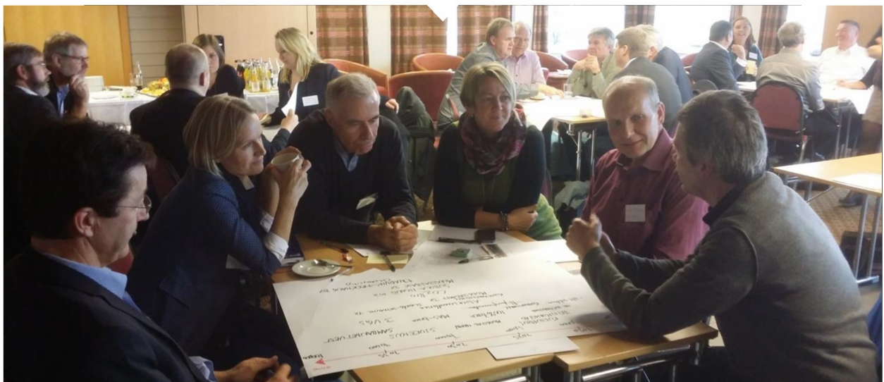
Figur 3. Politikarar, kommunetilsette og representantar frå næringslivet drøftar framtidig utvikling i Nordhordland. Frå gruppearbeidet på kick-off samlinga i november 2014.

Planen skal på offentlig høyring. Etter dette vil innkomne merknader til planen vurderast og planen gjerast klar for endeleg vedtak i regionrådet og kommunestyra.