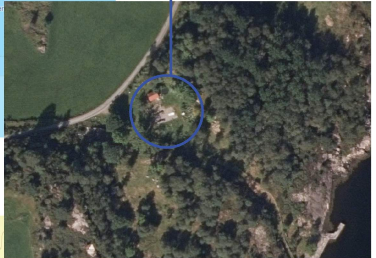
Kykkja og omriset av det tidligere våningshusets byggetomt