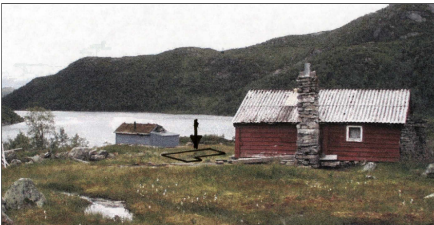
Foto frå byggesak ny jakthytte datert 1999