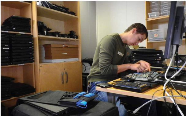
3.plass i Årets lokale klimatil­tak 2022: Indre Østfold for deres prosjekt med resirkulering av elektronisk utstyr.

Velkommen til å delta i Årets lokale klimatil­tak – en klimakonkurransen for kommunesektoren som arrangeres av KS, KBN Kommunalbanken og Miljøstiftelsen ZERO.