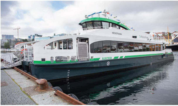
Vinner av Årets lokale klimatil­tak 2022: Rogaland fylkeskommune for verdens første elektriske hurtigbåt, Medstråum.