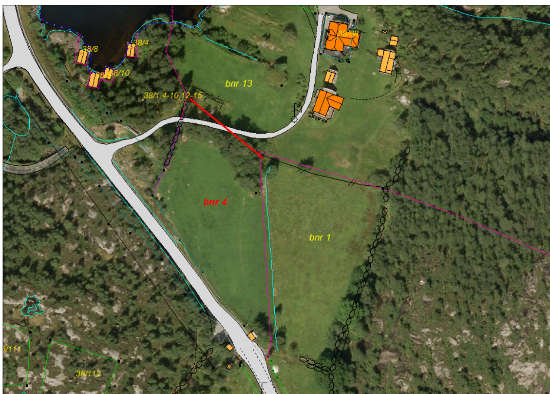
Kart som viser rettinga med raud strek mellom bnr 4 og bnr 13

Ut i frå dokumentasjonen over, meiner Masfjorden kommune at det er heimel for å få retta teig som manglar tilhøyrenade bruksnummer 4. Når ein har dokumentasjon på kvar eigedomsgrensene skal gå og naboane samtykker til rettinga, kan kommunen rette eigedomsgrensene i matrikkelen.