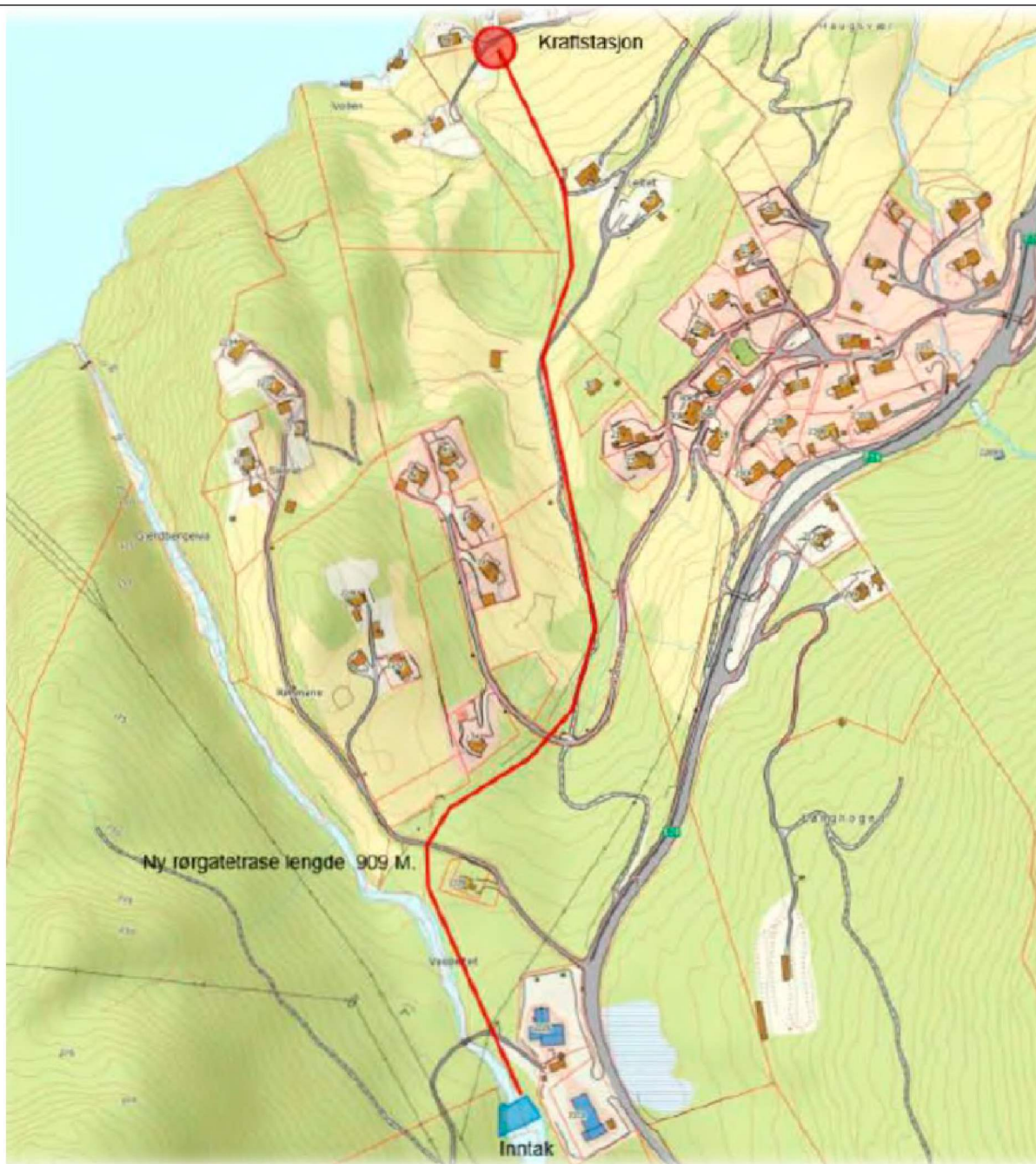
Kart 2: Omsøkt kabeltrasé, i rørgate