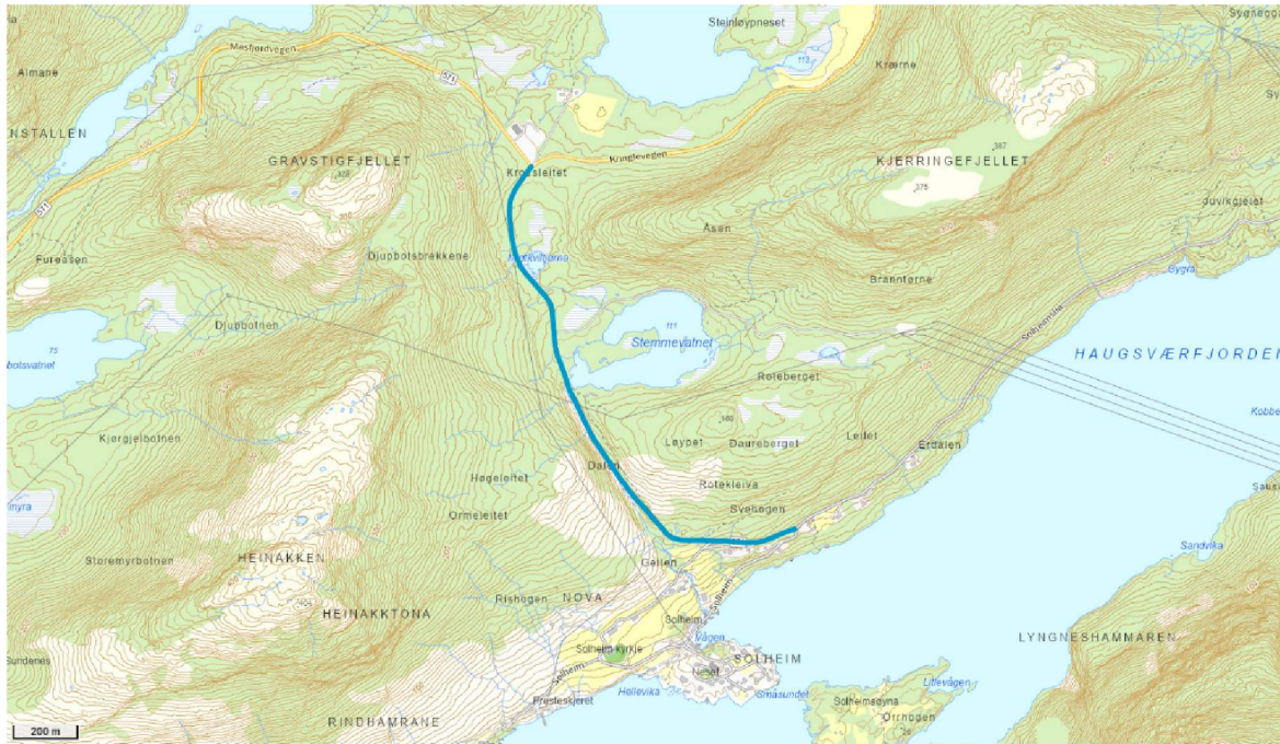
Figur 2: Strekninga som vi vurderer bør bli kommunal veg er vist med blått.