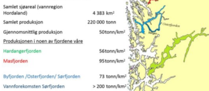
Figur 2: Akvakulturproduksjon per arealeining i nokre fjordar og fjordområde i Hordaland. Produksjonstala er estimert ut frå tildelt MTB.