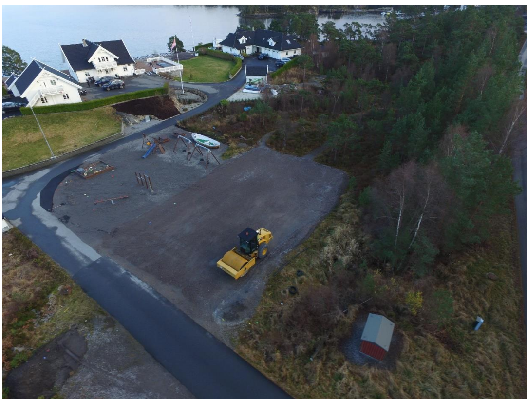
Bileta over og under syner området der ballbingen skal plasserast. Tomt er ferdig planert. Planert areal 32m x 16m