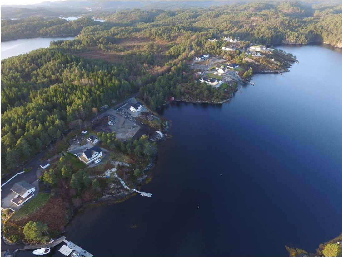
Bileta over og under syner delar av bustadfeltet i Skjelsundet. Ca 1/4 av alle elevane ved Nordbygda skule bur her og fleire hus er under bygging.