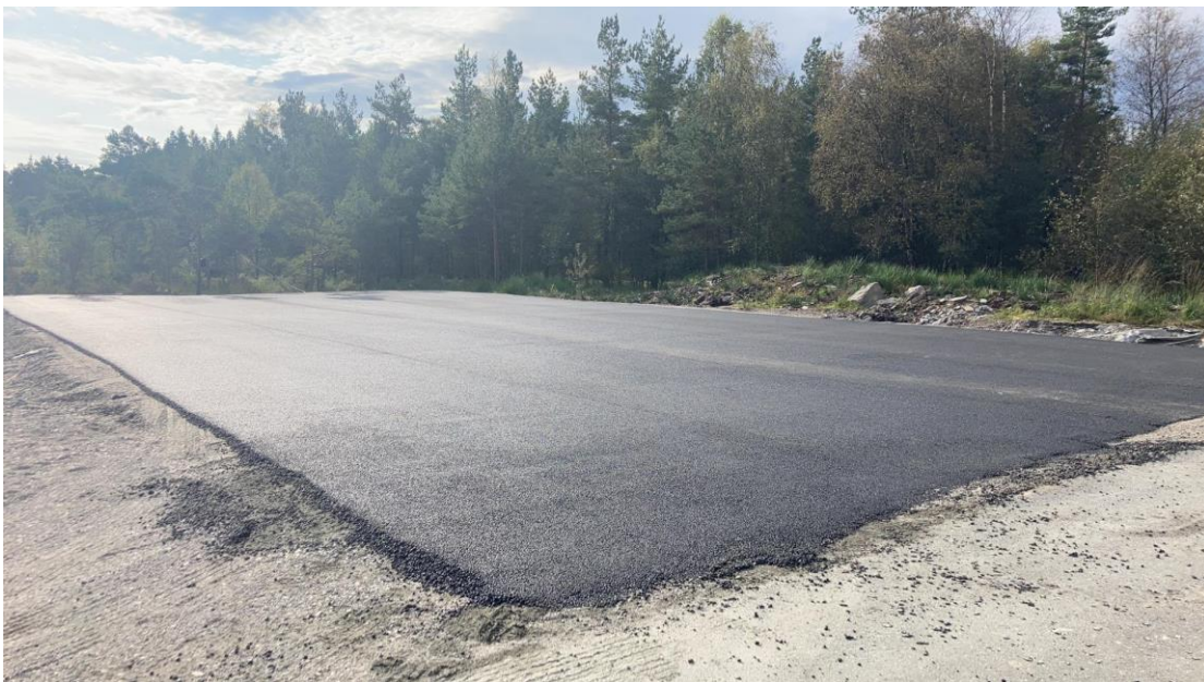
Bilde av område for ballbinga med ferdig lagt drenerande asfalt.