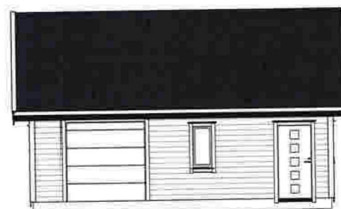
Fasade mot Nord