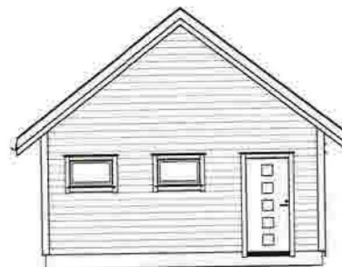
Fasade mot Aust