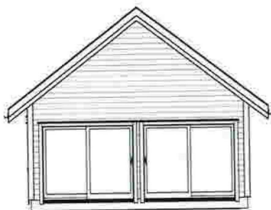
Fasade mot Vest